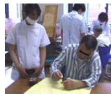
訓練室でリハビリ

脳卒中や老人期障害などの様々な心身機能の低下に対し、日常の生活で何気なく行っている作業活動を用いて様々な援助を行います。機能回復や維持とともに日常生活動作、つまり食事・排泄・入浴・更衣・家事・炊事など、その人にとって必要な動作を練習し、自立した生活ができるよう支援します。