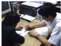
小児の言語リハビリ