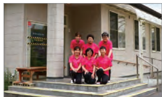
デイサービスセンターすずはり