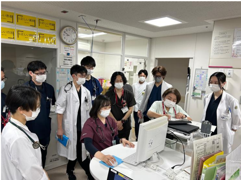
◀毎朝のカンファレンス・回診