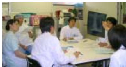
NST 情報交換と勉強会