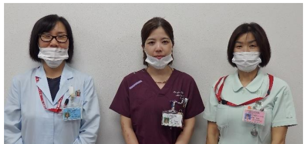
がんゲノム医療外来

がんゲノム外来受診に際しては、現在治療を受けておられる医療機関の主治医の先生からの紹介状が必要になります。患者さんががんゲノム医療の対象となるかどうかなど、ご不明な点がございましたら、「がん相談支援センター」にお電話ください。また、安佐市民病院 HP もご参照ください。