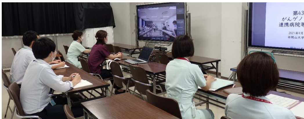
エキスパートパネル（Web形式での専門科会議）風景； 他職種でがん遺伝子パネル検査結果の検討を行っています。